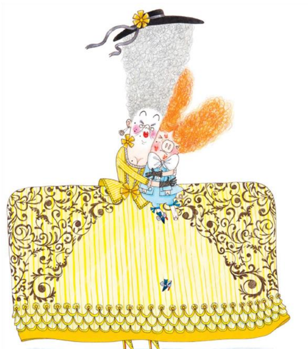
Стихотворение и иллюстрация из книги «Принц и Свинтус»

Ещё он заказал пирог с цукатами внутри, две полных вазочки желе, мороженого — три, четыре штруделя (сказать, чтоб не жалели джема), творожных пудингов штук пять и к ним шесть порций крема