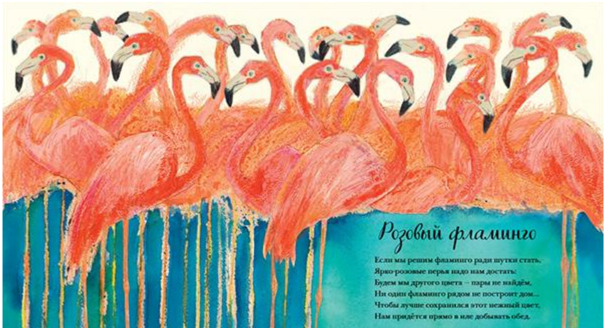
Стихотворение и иллюстрация из книги «Красивая книга о животных»

В таких книгах можно разглядывать картинки и мелодично сопровождать их чтением стихов.